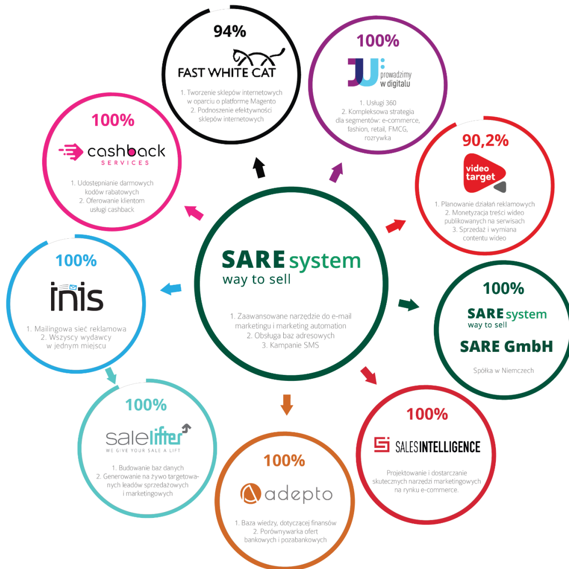
Wykres 1. Grupa Kapitałowa SARE S.A.