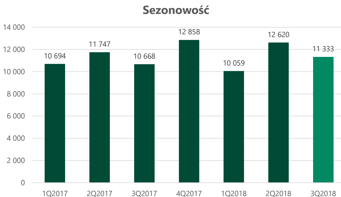
Wykres: Grupa SARE przychody ze sprzedaży

Wysokość osiągniętych przez Grupę SARE przychodów ze sprzedaży, nie podlega istotnym wahaniom sezonowości. Wyniki kolejnych kwartałów nie stanowią znacznego odchylenia względem siebie. Jedyne można zauważyć nieznaczny intensyfikację działań klientów Emitenta w czwartym kwartale każdego roku, co jest związane ze specyfiką okresu świątecznego w branży e-commerce. Potwierdzeniem powyższego jest załączony poniżej wykres.